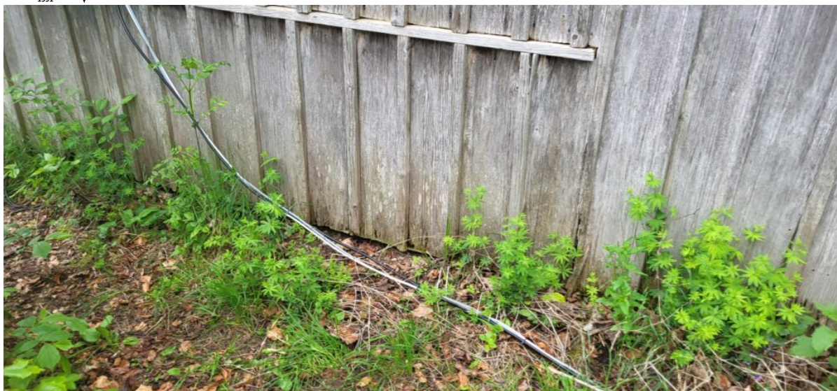
Kabel zur Loop